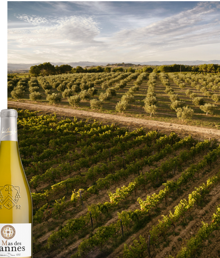
Le Mas des Tannes