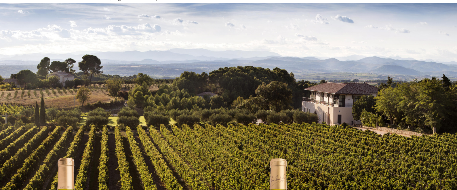
Château Paul Mas, Vignes de Nicole, le restaurant et la maison d'hôtes Côté Mas.

Les viogniers cultivés en plaine, sans stress hydrique mais avec des nuits fraîches, développent en revanche de délicieuses notes de fruits exotiques et de buis. Commence alors une longue expérimentation pour comprendre le profil organoleptique que produit chaque type de terroirs. Coteaux argilo-calcaires ou marno-calcaires, plateau villafranchien ou plaine alluviale ne produisent pas les mêmes résultats. Jean-Claude Mas vinifie aujourd'hui la variété dans de nombreuses cuvées, une dizaine en monocépage. À Montagnac, en plaine ou sur les coteaux, entre fossés envahis de roseaux et l'Hérault, naissent de nombreux blancs du pays d'Oc, comme les historiques Vignes de Nicole et Viognier Le Pioch .