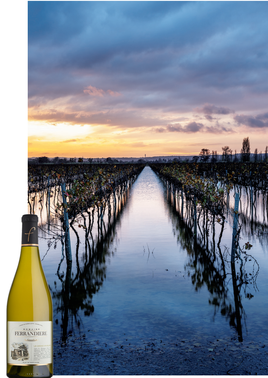
Domaine de la Ferrandière

Grâce à cet écosystème original, les dix-huit cépages complantés, tous originaires du Midi, produisent sur cette terre fertile des résultats extraordinaires, faisant la preuve que des rendements élevés ne sont pas incompatibles avec l'élaboration de grands vins.